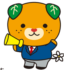
愛媛県 イメージアップ キャラクター みきやん

※携帯メールアドレスはご登録いただけません。 ※ご登録いただいた情報は適正に管理し、本事業のみに利用いたします。